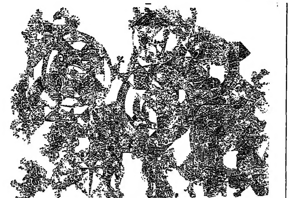
وتتبع الارض دورتها

ما معنى هذا الحوار؟ ما هو المقصود من التعليق عليه في هذه الوقت بالذات، وقت الخوف من الليبرالية الازفة الى العدم، وقت الهلع من دوامة العنف الجونون المتداعي، والتعلق على مصرع الابناء والاحتفال والاضطراب المتكاثم يوما بعد يوم في استنحال القدر والغضب، وتلاشي الرق والهمجية؟